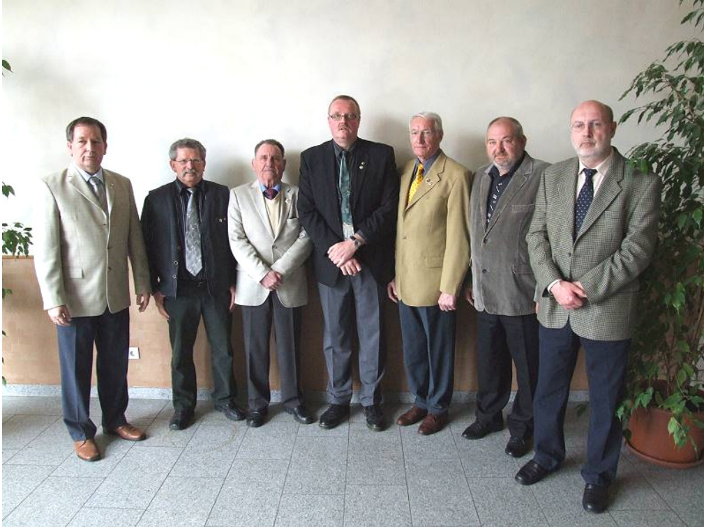
Neu ernannte Ehrenmitglieder Jahreshauptversammlung vom Landesverband am 03. April 2011 in Hamm