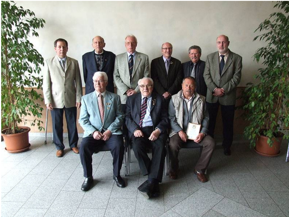
Neu ernannte Meister Jahreshauptversammlung vom Landesverband am 03. April 2011 in Hamm